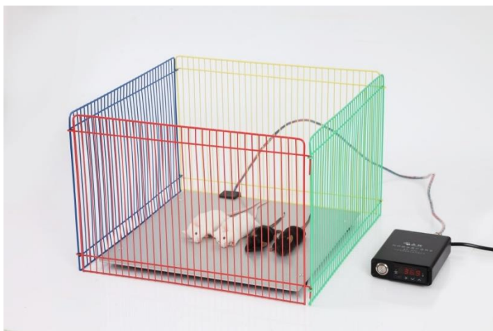
附图 2 实验动物保温热台

4. 实验动物在麻醉及苏醒过程中必须注意保温，防止因失温导致死亡。建议使用本公司实验动物保温热台（附图 2）。